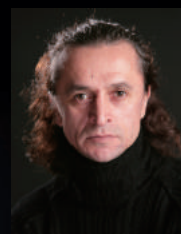
ファルフ・ルジマトフ Farukh Ruzimatov

桶狭間の戦い、比叡山の焼き討ち、本能寺の変、そして終景へ。400年以上前のSAMURAIたちの生き様が、緊迫感あふれる舞台となる。